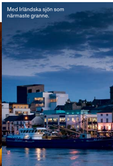
Med Irländska sjön som närmaste granne.